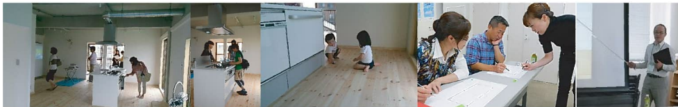
※上記は第1期【リノベSCHOOL!】IN シティマンション国富開催時のものです。たくさんのお客様で賑わいました!

当社では表面の【リノベSCHOOL!】の取り組みにより、築古物件をリノベーションし、ライフラインや構造躯体の性能を必要に応じて改修し、間取りや内外装を刷新する取り組みを始めたところ、リノベーション費用をかけても新築に比べリーズナブルに住まいを取得することができるため築後20年以上のビンテージ不動産を望まれるお客様が大変増えております! 不動産の売却運用をお考えの方、ぜひお気軽にお問合せ下さい!