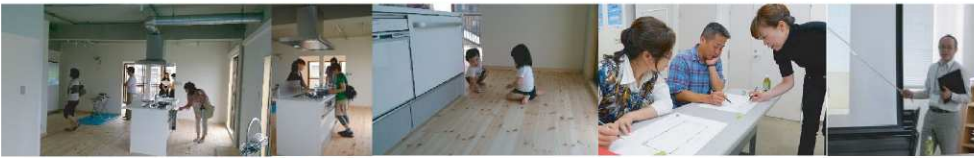
※上記は第1期【リノベSCHOOL!】INシティマンション国富開催時のものです。たくさんのお客様で賑わいました！

当社では表面の【リノベSCHOOL!】の取り組みにより、築古物件をリノベーションし、ライフラインや構造躯体の性能を必要に応じて改修し、間取りや内外装を刷新する取り組みを始めたところ、リノベーション費用をかけても新築に比べリーズナブルに住まいを取得することができるため築後20年以上のビンテージ不動産を望まれるお客様が大変増えております！不動産の売却運用をお考えの方、ぜひお気軽にお問合せ下さい！