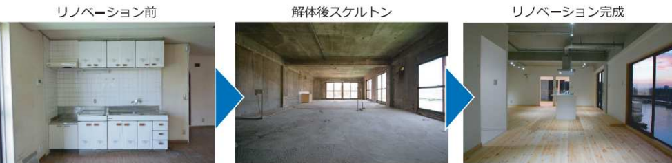
リノベーション前