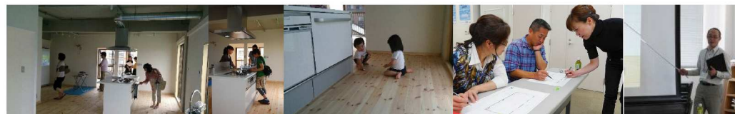
※上記は第1期【リノベ SCHOOL!】IN シティマンション国富開催時のものです。たくさんのお客様で賑わいました！