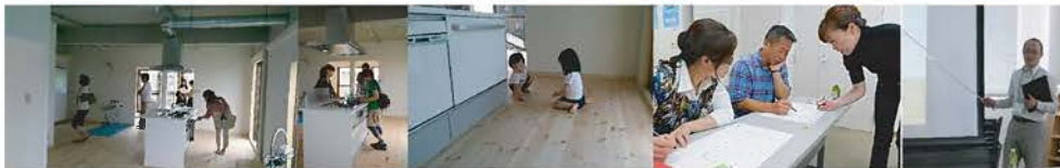
※上記は第1期【リノベSCHOOL!】IN シティマンション国富賢催時のものです。たくさんのお客様で賑わいました!

当社では表面の【リノベSCHOOL!】の取り組みにより、築古物件をリノベーションし、ライフラインや構造躯体の性能を必要に応じて改修し、間取りや内外装を刷新する取り組みを始めたところ、リノベーション費用をかけても新築に比べリーズナブルに住まいを取得することができるため築後20年以上のビンテージ不動産を望まれるお客様が大変増えております! 不動産の売却運用をお考えの方、ぜひお気軽にお問合せ下さい!